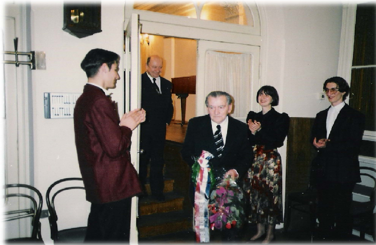
Ivo Maček i Stjepan Radić (u pozadini) s izvođačima nakon koncerta u Hrvatskom glazbenom zavodu, 23. ožujka 1994.