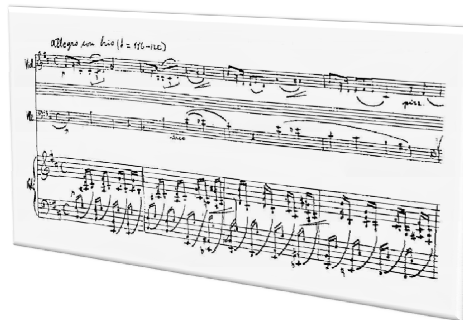
I. Maček: Glasovirski trio , t. 18-21