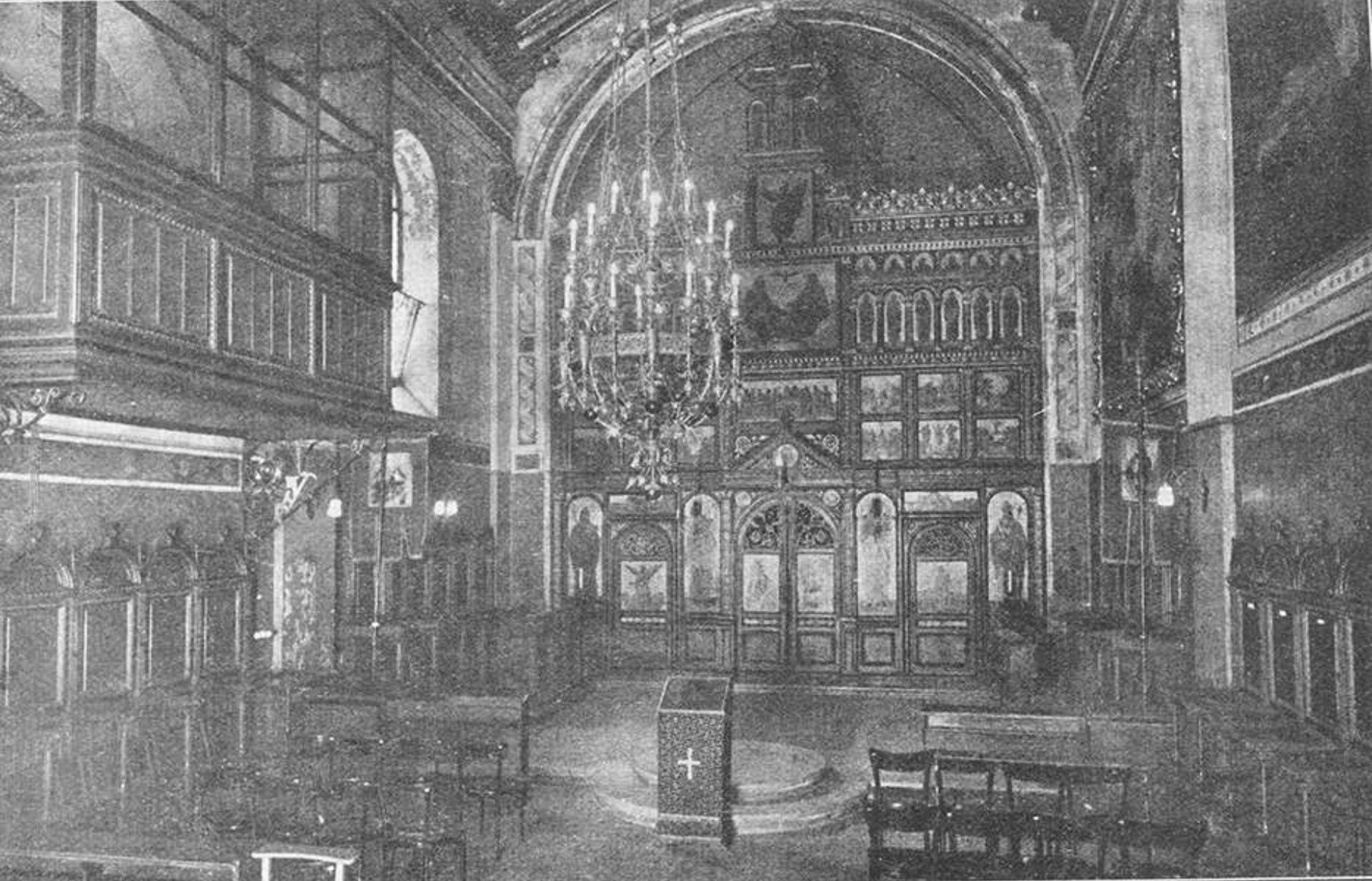
Konkatedrala sv. Ćirila i Metoda u Zagrebu, početkom 1930-ih godina