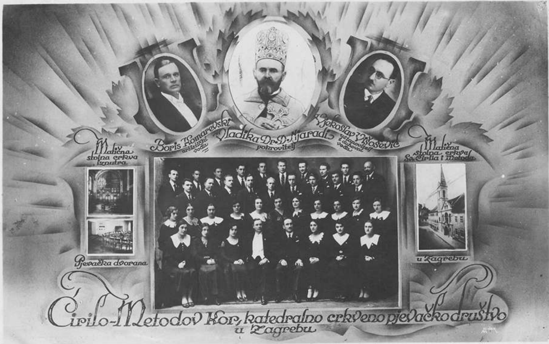
Mali stolna crkva iznutra