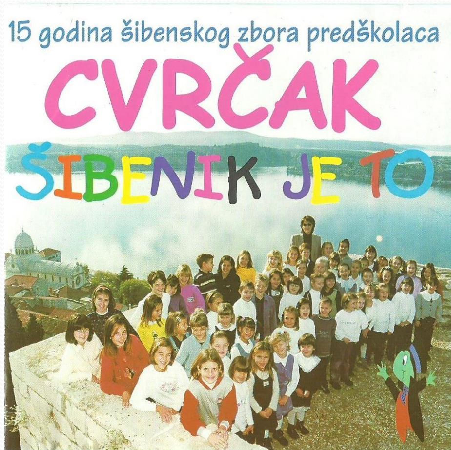
Naslovnica 2. CD-a

- 2000. godine povodom 15 godina djelovanja izdaje drugi nosač zvuka Šibenik je to 6 pjesama + glazbena priča Tri prašćića