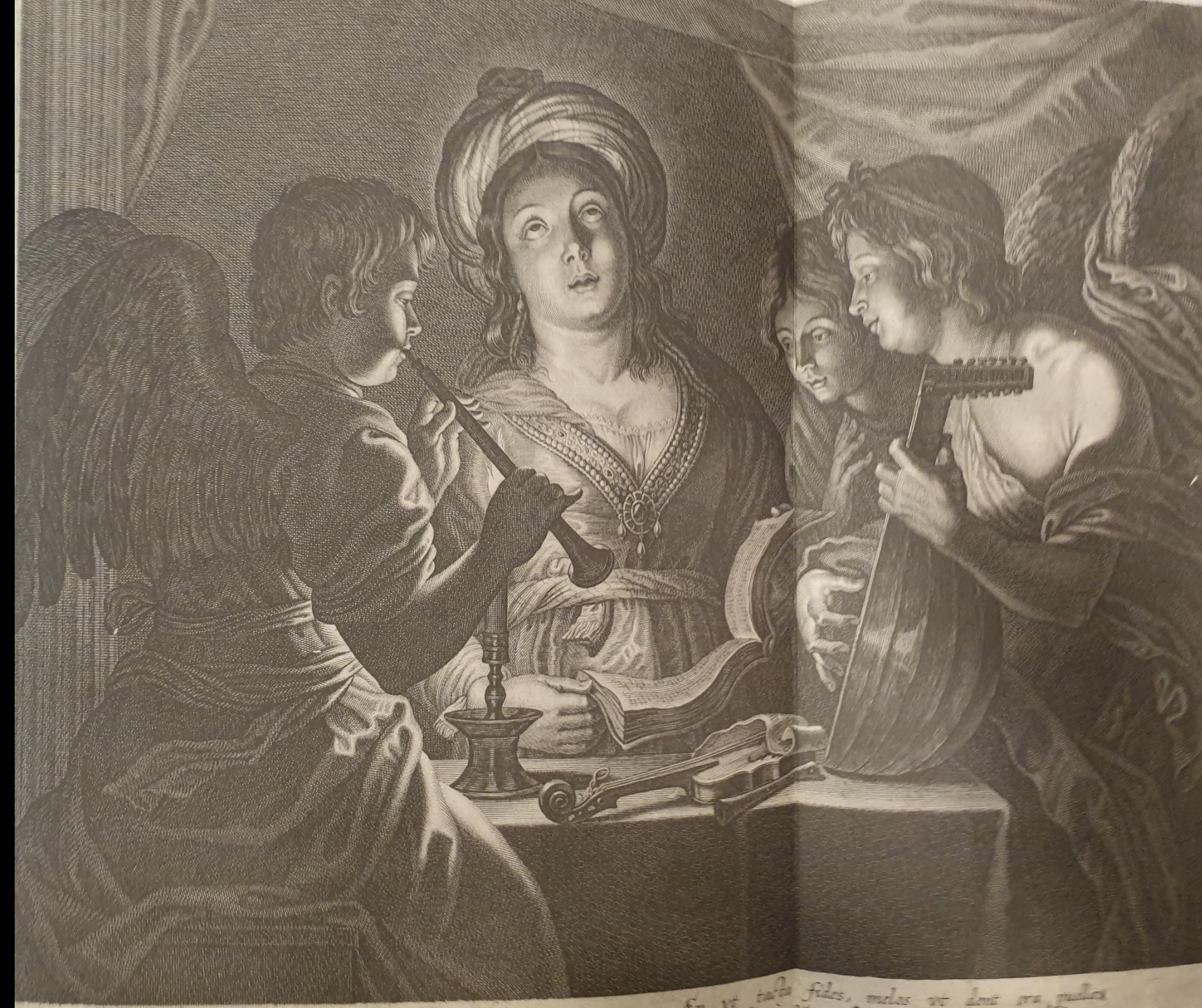
Nicolas Lauwers (prema Gerhardu Seghersu): Sveta Cecilija s anđelima (VZ VIII 282)