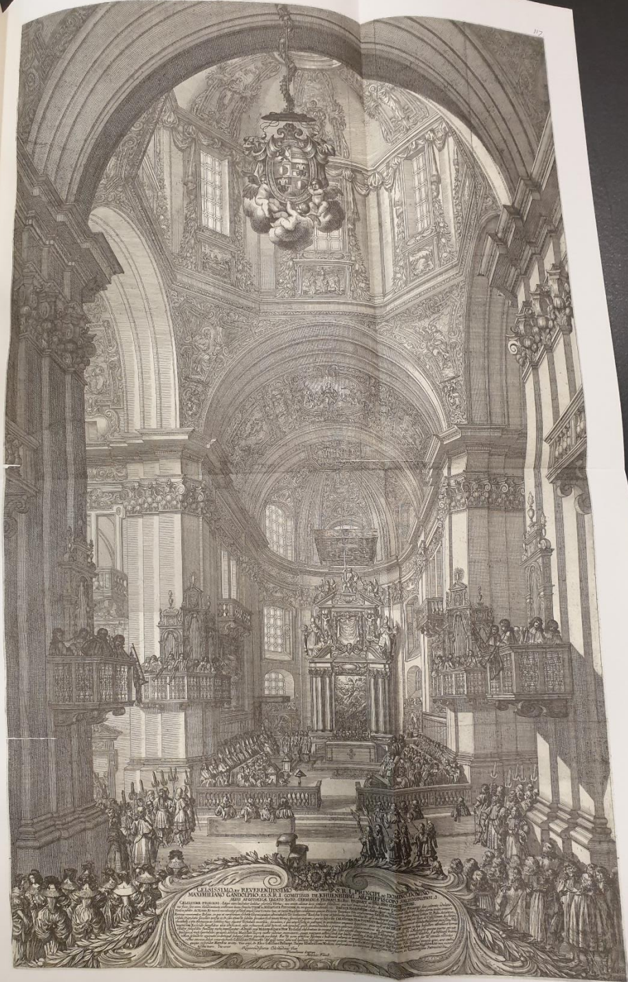
lijevo: Melchior Küsel: Unutrašnjost katedrale u Salzburgu (VZ VI 117)