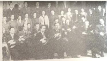
MALI ZBOR I TAMBURAŠKI ORKESTAR RADIO ZAGREBA