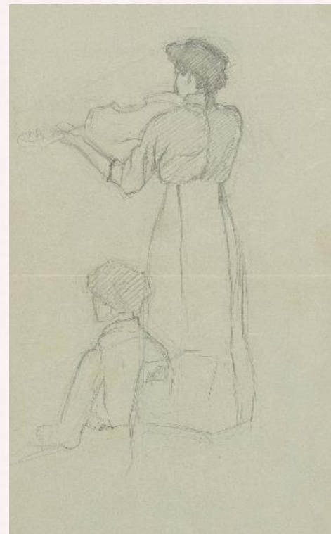
Crtež stojeće ženske figure s violinom i sjedeće figure za klavirom – vjerojatno studija D. Pejačević (HGZ II-Pej-IV, 25)