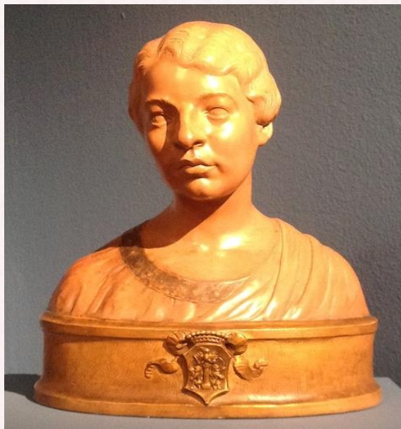
Bista Dore Pejačević, izradio David Jelovšek 1916. Hrvatski povijesni muzej (HPM/PMH-30904).