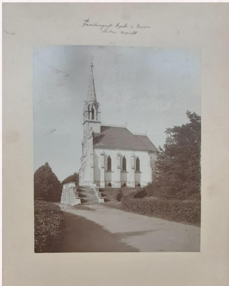
Fotografija kapele obitelji Pejačević u Našicama, oko 1900.