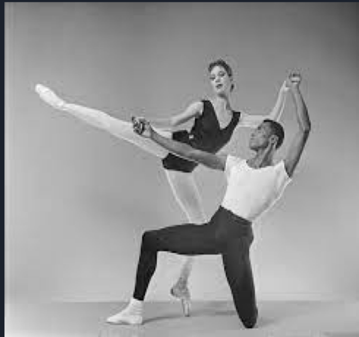
Arthur Mitchell i Diana Adams (NYCB) Igor Stravinski, George Balanchine: Agon