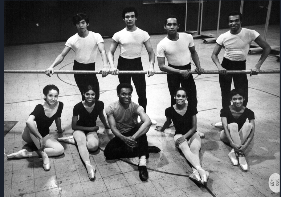
Arthur Mitchell i Dance Theatre of Harlem