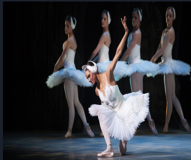
Misty Copeland P. I. Čajkovski: Labuđe jezero