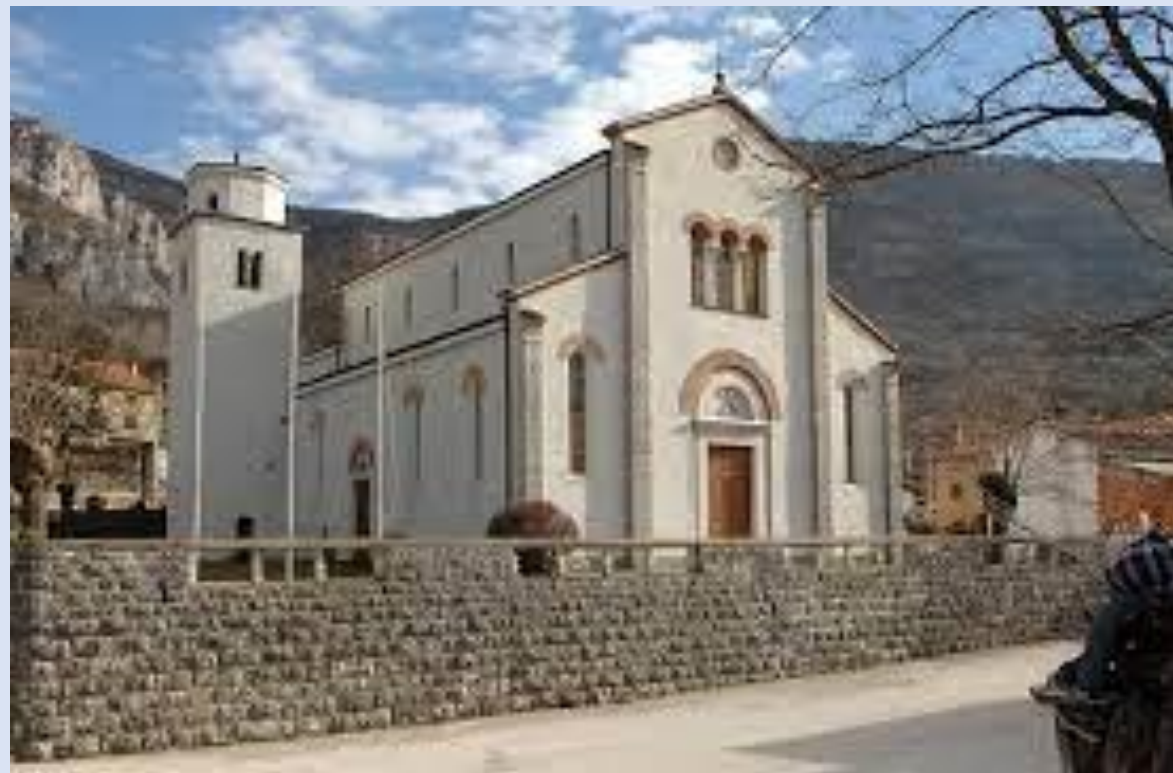
Župna crkva svetih Kancija, Kancijana i Kancijanile