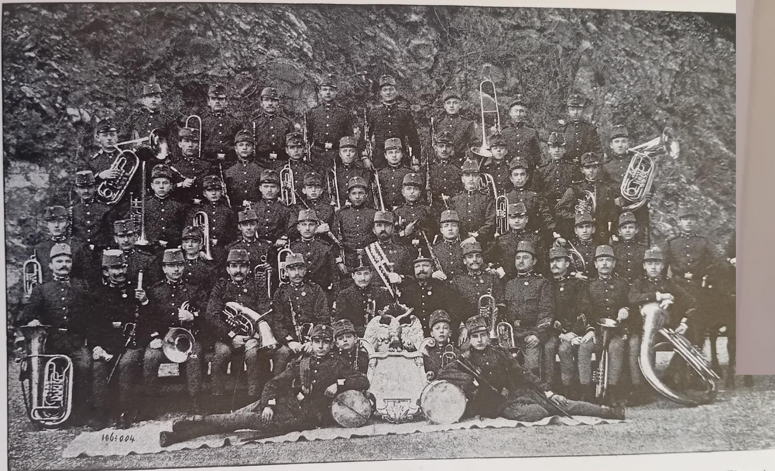
Gruppenbild der Kapelle des 79. (Ungarisch-croatischen) Inf.-Regts. „FZM. Graf Jellačić de Bužim“ (Fiume).