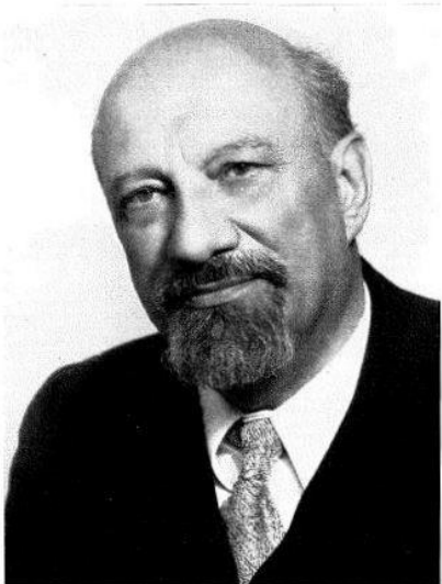
ZBORSKE SKLADBE HRVATSKI GLAZBENI ZAVOD ZAGREB, 12. XII. 1971.